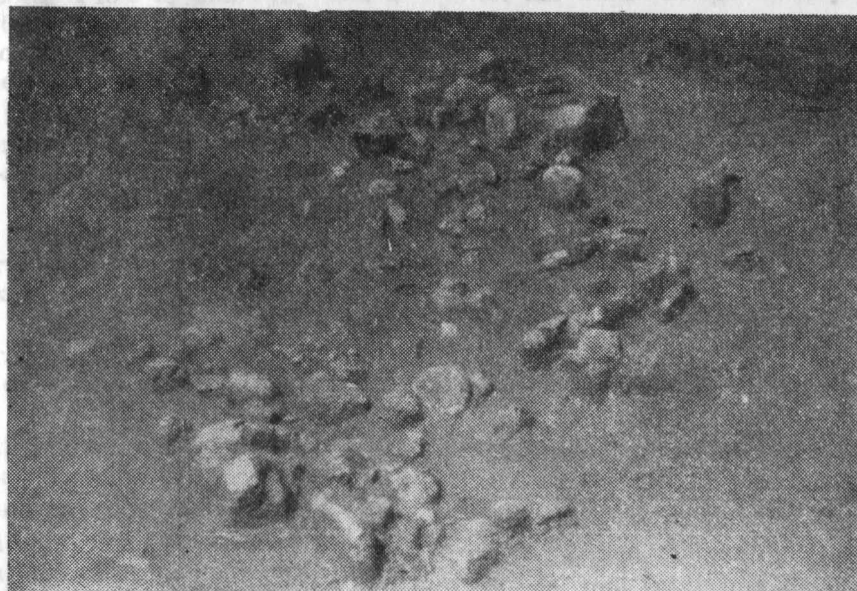
Fig. 3. Ostrovu Mare-Portile de Fier. 1 mormintul cu scheletul stînd pe o bancă de pămînt și nisip; 2 vatră de locuință de tip Schela Cladovei de la km 875.