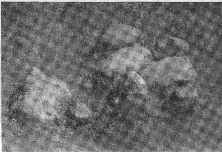
Fig. 2. Ostrovu Mare-Portile de Fier. 1 vatră de locuință din stratul epipaleolitic I de la km 875; 2 vatră de locuință de la km 873 nivelul 1, aparținând culturii Schela Cladovei.